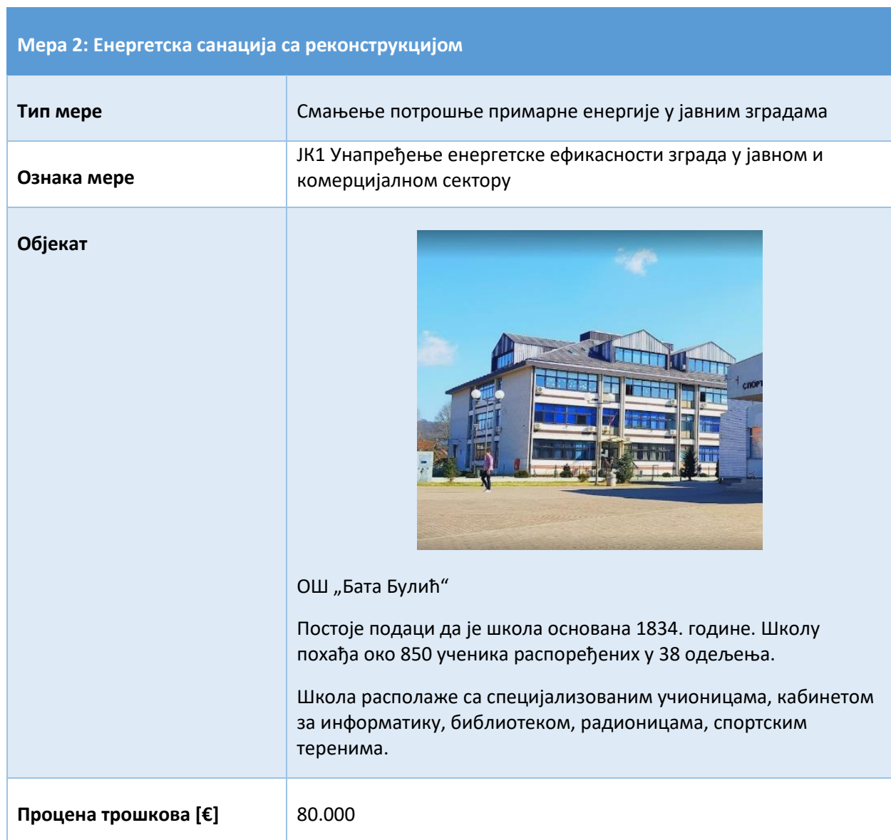
Табела 2. Енергетска санација са реконструкцијом ОШ „Бата Булић“