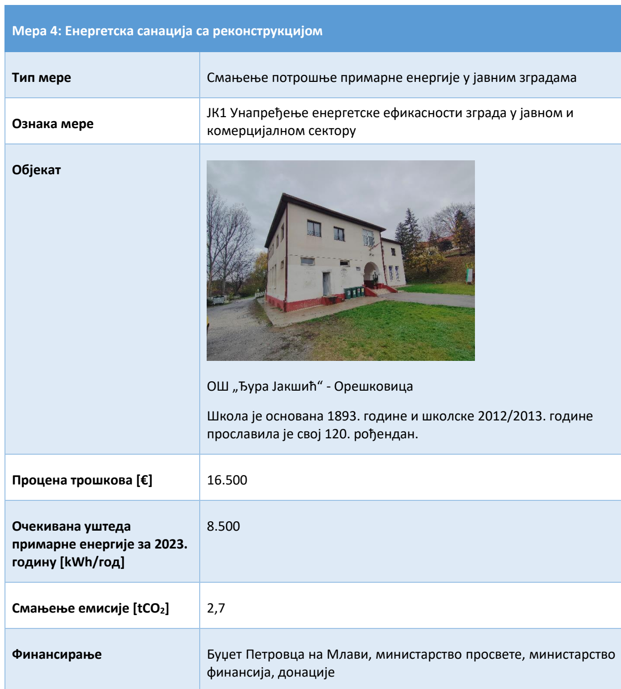
Табела 4. Енергетска санација са реконструкцијом ОШ „Ђура Јакшић“ – Орешковица