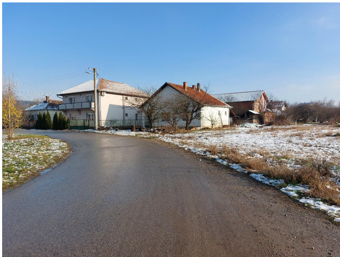
Slika 3 - Prikaz lokacije na kojoj je planirana izgradnja objekta