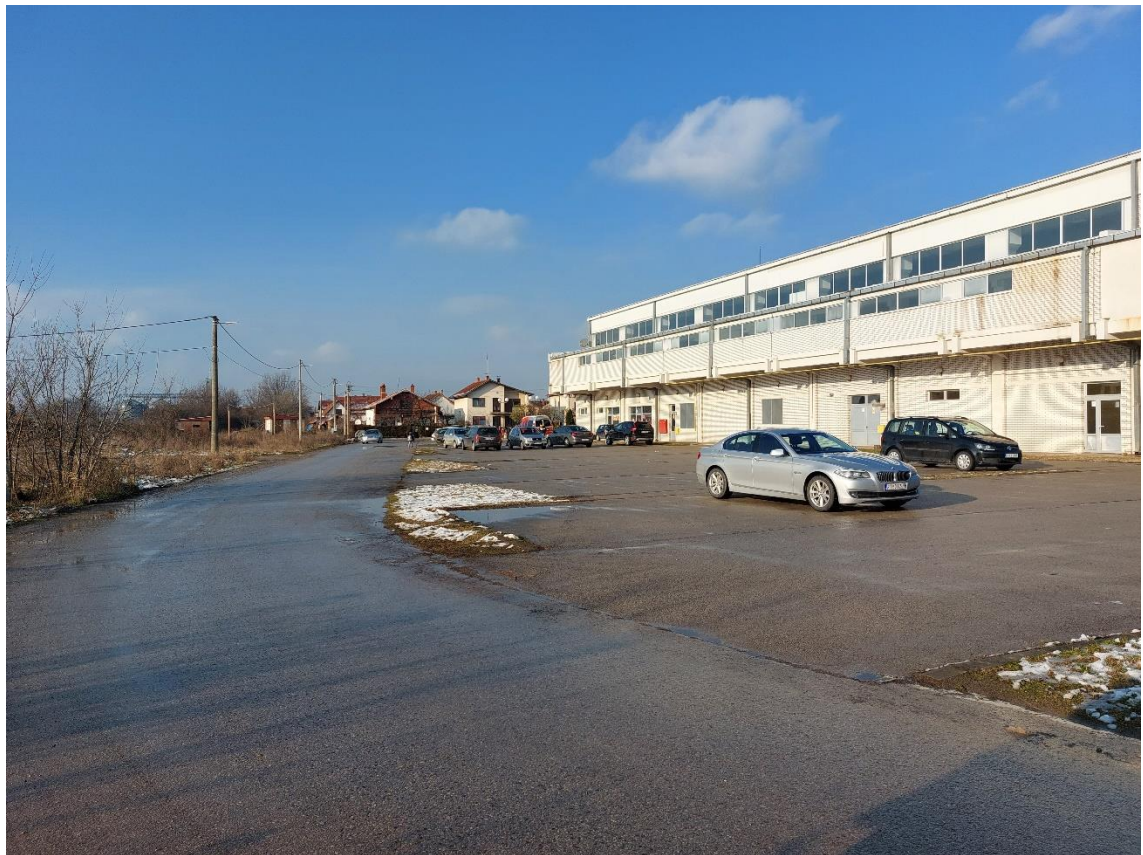
Slika 5 - Prikaz lokacije na kojoj je planirana izgradnja objekta