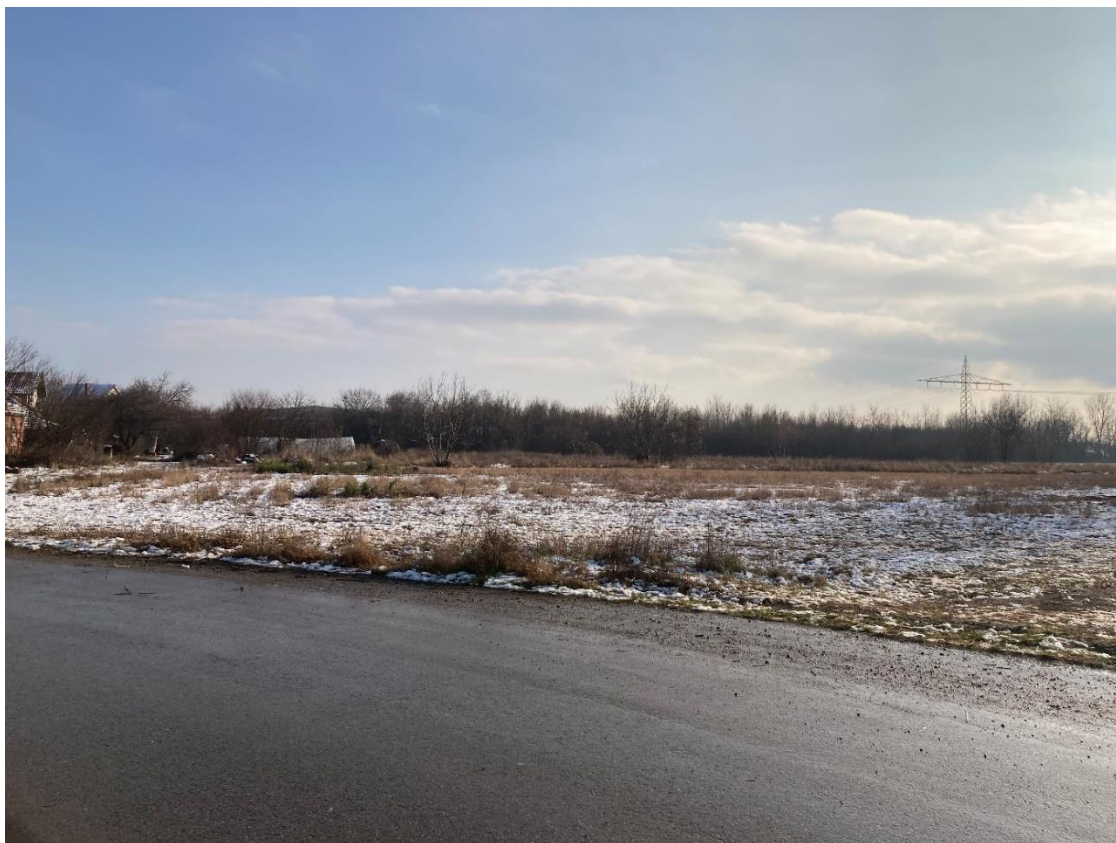
Slika 2 - Prikaz lokacije na kojoj je planirana izgradnja objekta

Ovim PzUŽSSO razmatra se izgradnja novog objekta kao intervencija planirana ovim potprojektom.