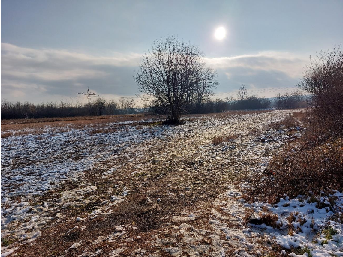
Slika 4 - Prikaz lokacije na kojoj je planirana izgradnja objekta