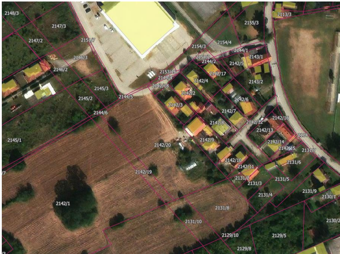
Slika 1 - Pogled iz vazduha na parcelu br. 2142/20 KO Petrovac na Mlavi, na kojoj će se nalaziti planirani objekat