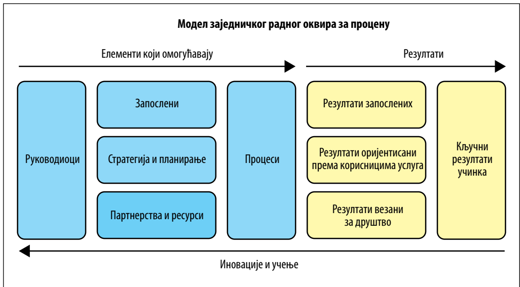
Слика 2: Заједнички радни оквир за процене – Common Assessment Framework

Пре него што примени CAF, тим би требало да се упозна са публикацијама везаним за CAF које су лако доступне било путем Европског института за државну управу било путем интернета.